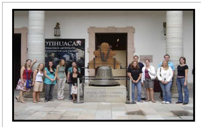
Interior de la Alhóndiga de Granaditas

Con este ejército triunfó Hidalgo en Celaya, siendo su siguiente objetivo Guanajuato. Fuertemente armados, los españoles resistían en la Alhóndiga de Granaditas todos los intentos de los insurgentes para apoderarse del edificio, que era una fortaleza en la cual se almacenaban granos para el tiempo de escasez, esfuerzo inútil que costaba muchas vidas a las tropas mal armadas de Miguel Hidalgo. En ese momento, el Pipila, poniéndose una gruesa losa en la espalda, se arrastró en medio de nutrida balacera hasta la puerta de la Alhóndiga, prendiéndole fuego con una tea ardiendo, pronto cedió la puerta con lo