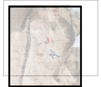
Descenso a rappel.

rappel puedes admirar la maravillosa vista de la ciudad