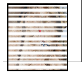
Descenso a rappel.

rappel puedes admirar la maravillosa vista de la ciudad