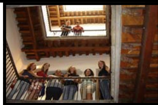
Museo de Diego Rivera

Olga Costa y José Chávez Morado. Martes a Sábado de 9:30 a 16:00 horas. Domingo de 10:00 a 15:30 horas.