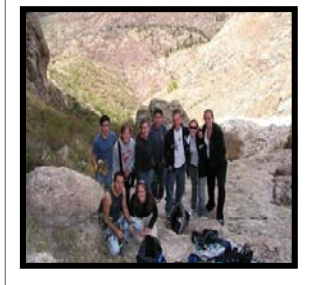
Subida a la Bufa.

Guanajuato además de ser mundialmente conocido por su cultura y arte, es un lugar perfecto para quienes gustan del deporte extremo y la buena aventura.