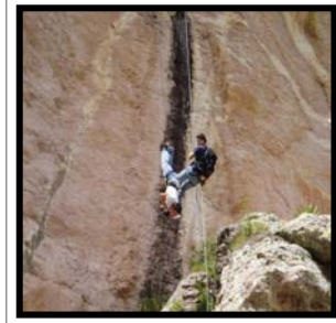
Descenso a rappel.

No tendrás que ir muy lejos, ubicado a un costado de la ciudad se levanta el Cerro de la Bufa, una formación rocosa desde donde además de practicar la escalada y el