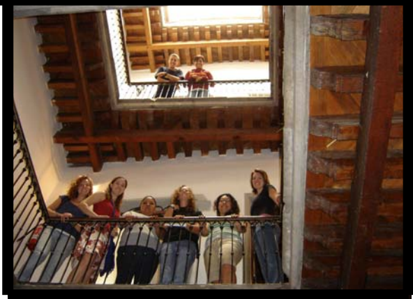
Visita al Museo de Diego Rivera. 18 de agosto.