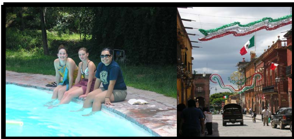
Tour por la ciudad de San Miguel de Allende. 8 de septiembre.