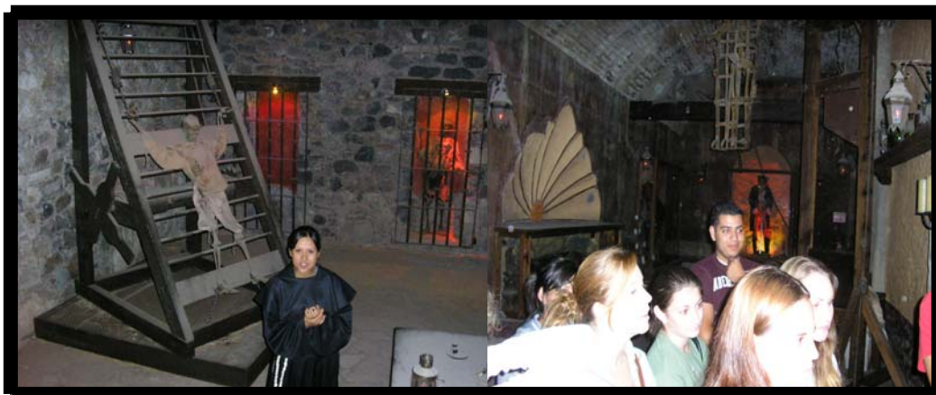
Visita a la Ex-hacienda del Cochero. 25 de agosto.