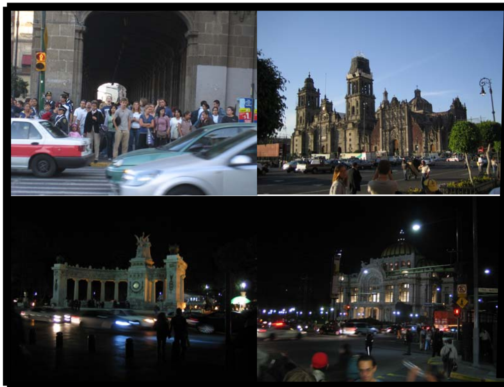
Tour por la ciudad de México. 10 de noviembre.