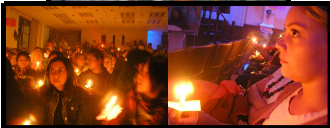
Día de Muertos, en la Escuela de Idiomas. 31 de octubre.