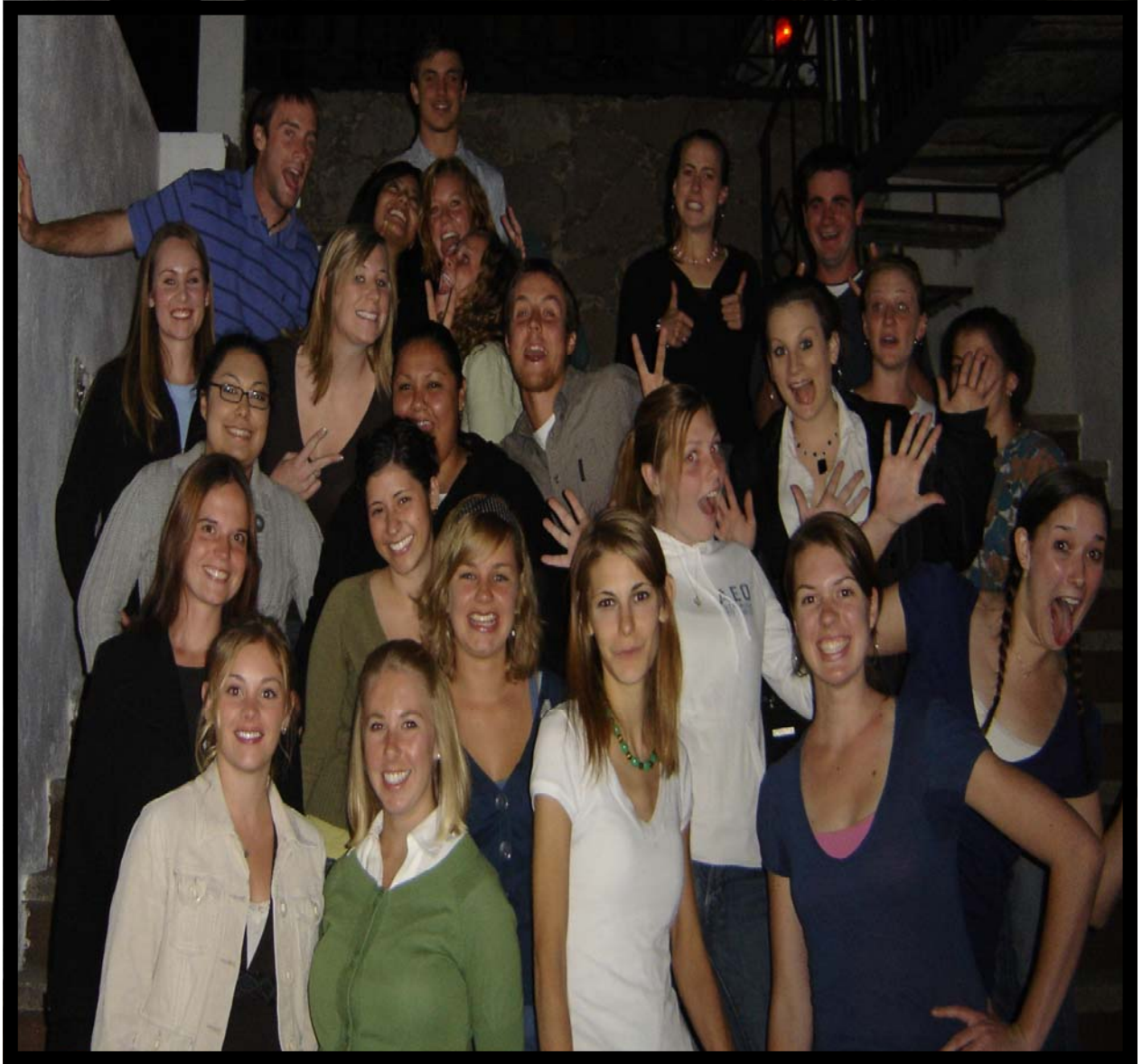
Fiesta de despedida. 22 de noviembre.