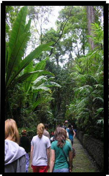
Tour al Parque Nacional de Uruapan. 5 de agosto.