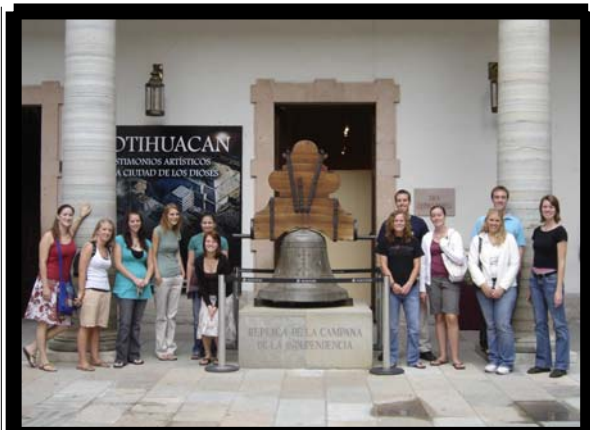
Visita al Museo de la Alhóndiga 18 de agosto.