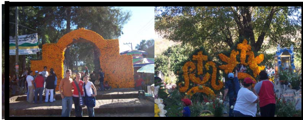
Día de Muertos. 1 de noviembre.