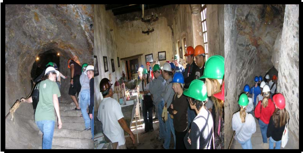
Visita a la Bocamina de San Cayetano. 25 de agosto.