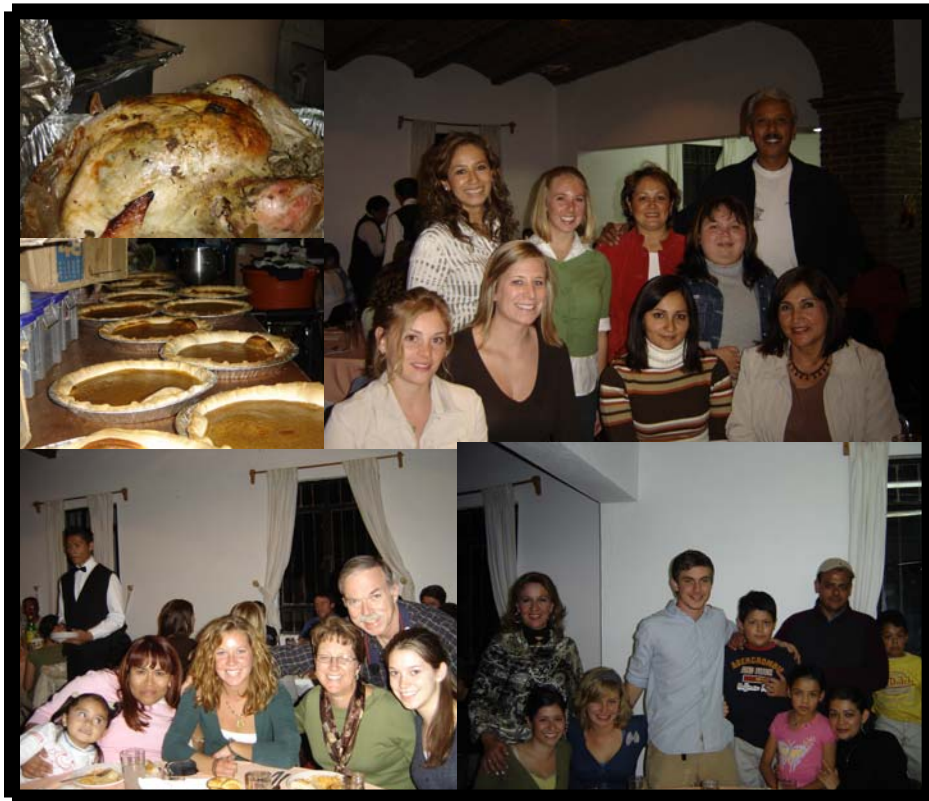
Día de Gracias y fiesta de despedida. 22 de noviembre