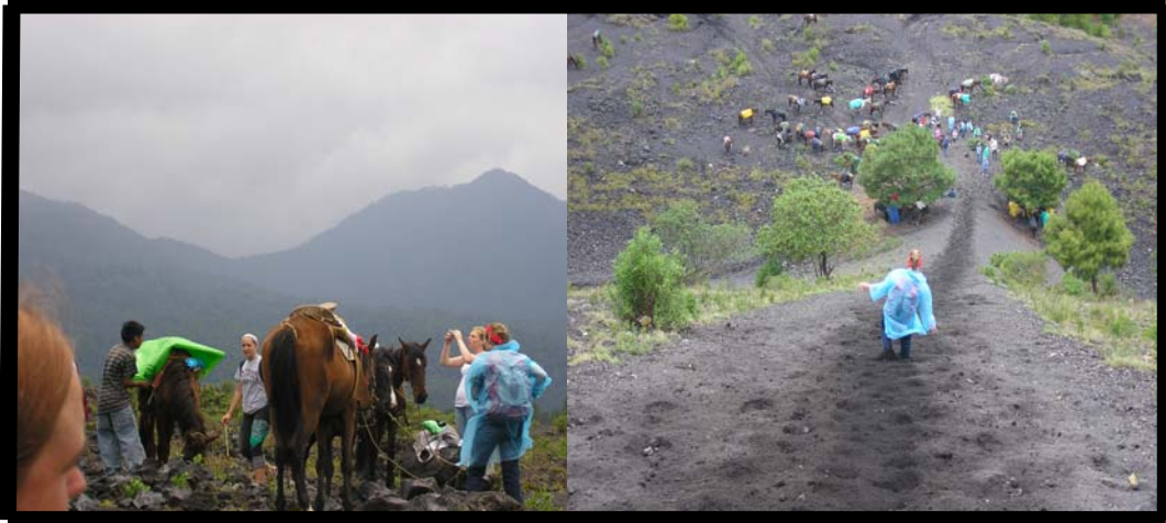
Tour al Volcán Parícutín. 4 de agosto.