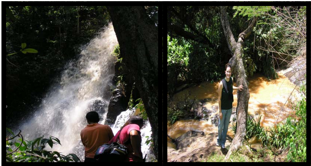
Tour a la Zararacua y Zararacuita. 3 de agosto.