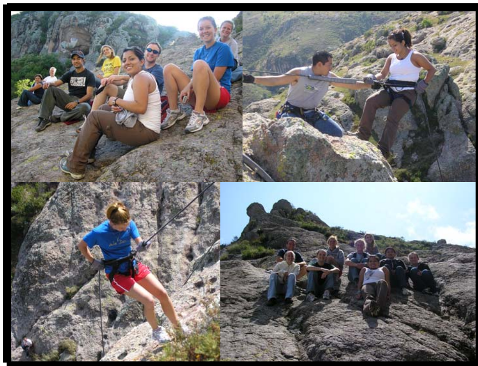
Tour a la Bufo. 30 de septiembre.