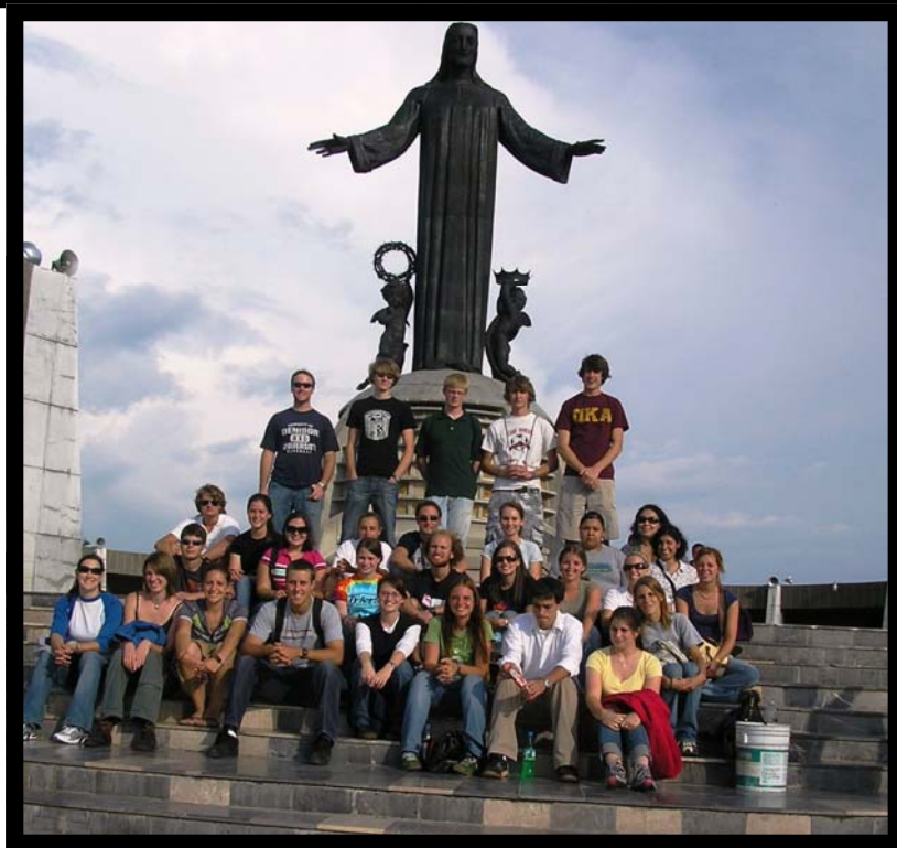
Tour a Cristo Rey. 31 de julio.