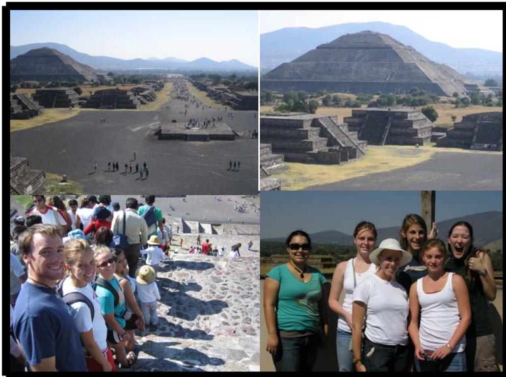
Tour por la zona arqueológica de Teotihuacan. 11 de noviembre.