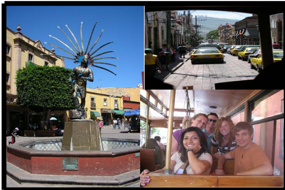
Tour por la ciudad de Querétaro. 22 de septiembre.