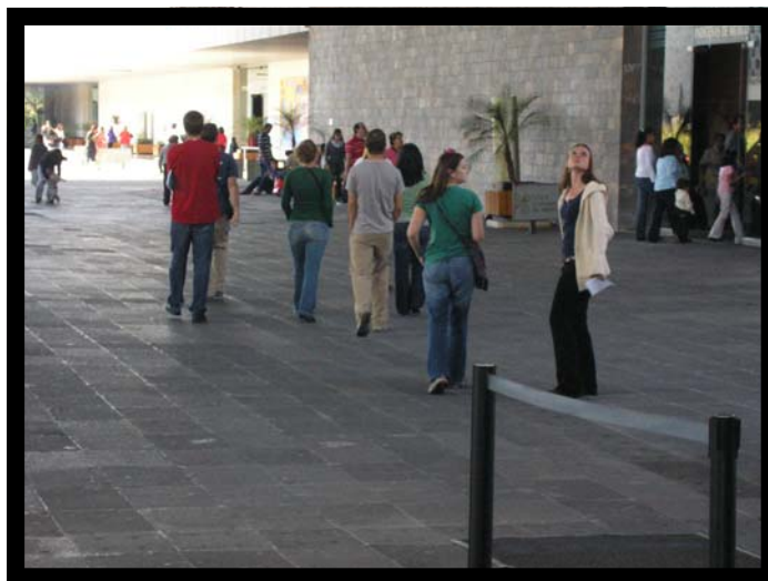
Tour por el Museo de Antropología. 10 de noviembre.