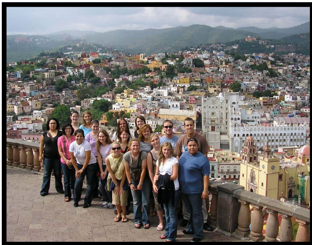
Tour por la ciudad de Guanajuato. 30 de julio.

Ha llegado el momento de la partida, parece que fue ayer cuando el nuevo grupo llegó, el domingo 29 de julio, quedó atrás, pero ahora que el fin del semestre se acerca, las imágenes de todos los momentos agradables quedan en nuestra memoria, como testigos de que hemos aprovechado muy bien nuestro tiempo en Guanajuato, México.