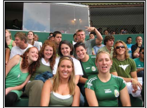
Fut-bol en León, Gto.