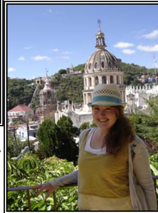
Vista de la Escuela de Idiomas.