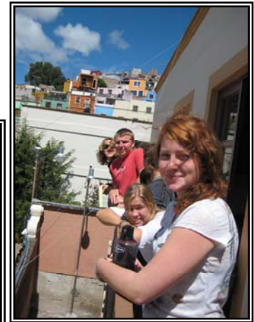
Grupo en la Escuela de Idiomas.