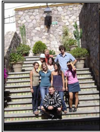
Grupo en la Escuela de Idiomas.